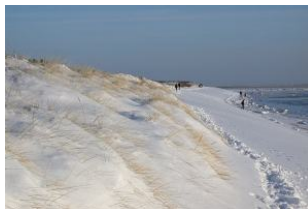
Strand im Winter