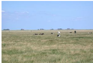
Natur Pur genießen