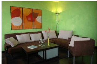
ob von der gemütlichen Couchgarnitur