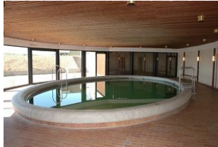
Schwimmbad im Haus (kostenfreie Nutzung!)