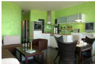
oder aus der vollausgestatteten Küche mit Esstisch.