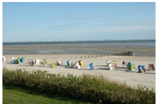
mit traumhaftem Ausblick

Die sehr beliebte Ferienwohnanlage "Bi de Wyk" liegt direkt am Südstrand von Wyk und bietet Ihnen einen herrlichen Blick auf die Nordsee, zu den Halligen und nach Amrum. Einkaufsmöglichkeiten, Restaurants, Kurmittelhaus, Trimpfad und die Bushaltestelle befinden sich in unmittelbarer Nähe. Ein Urlaub ohne Auto ist kein Problem. An Wellness-Angeboten stehen Ihnen im Haus ein Schwimmbad und eine Sauna zur Verfügung. Die sehr hochwertig eingerichtete 2 Raum-Wohnung liegt im mittleren Teil des Gebäudes im 2. OG (Fahrstuhl ist vorhanden). Bitte beachten Sie: In der Nachbarschaft soll im Frühjahr 2016 ein Neubau entstehen