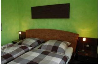
Ein Wohlfühl Schlafzimmer für Ihren erholsamen Schlaf