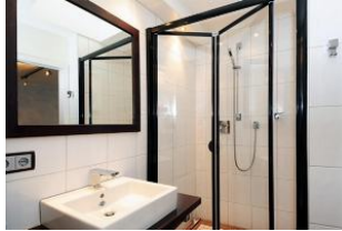
Helles Bad mit Dusche